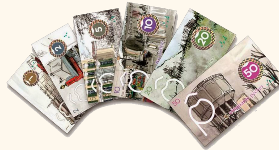
Illustration : Cendrine Bonami-Redler

Je suis artisan, commerçant, libéral, chef d'entreprise, je peux adhérer à la pêche monnaie locale en signant la charte « l'accord pour entreprise » en présence d'un représentant ou en l'envoyant par courrier. Ensuite, je peux échanger mes euros contre des pêches. Il existe six valeurs de coupons-billets différentes :